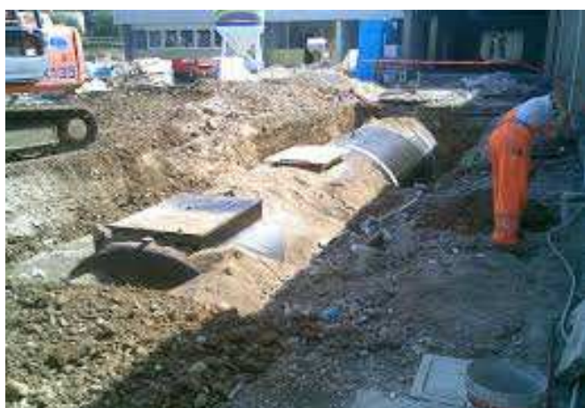
REALIZZAZIONI IMPIANTI ANTINCENDIO Realizzazione di cisterne sia da interro che da esterno con gruppo di pressurizzazione separato o monoblocco e pompe ad immersione.