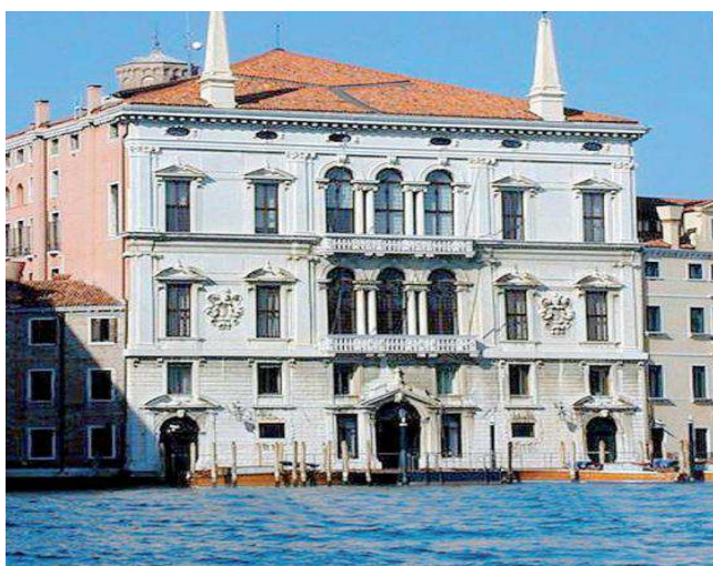
PALAZZO BALBI (VENEZIA) Progettazione esecutiva ed esecuzione lavori di rifacimento Centrale Termica.