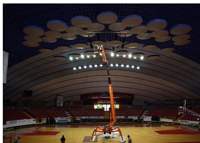
STRUTTURA POLIFUNZIONALE PALASPORT "TALIERCIO" Mestre -Ve- Impianto di illuminazione.