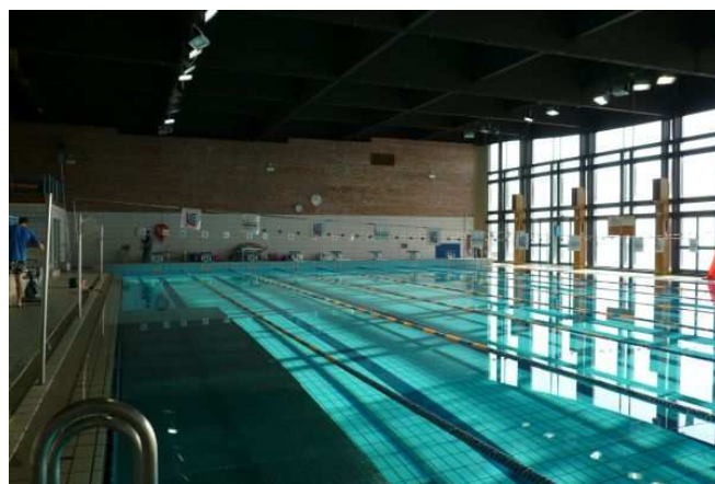
PISCINA COMUNALE DI SACCA FISOLA (VENEZIA) Interventi di manutenzione degli impianti.