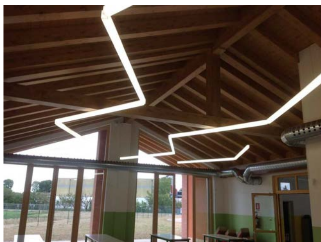
NUOVA SCUOLA DI TRIVIGNANO (VE) Impianti elettrotecnici.