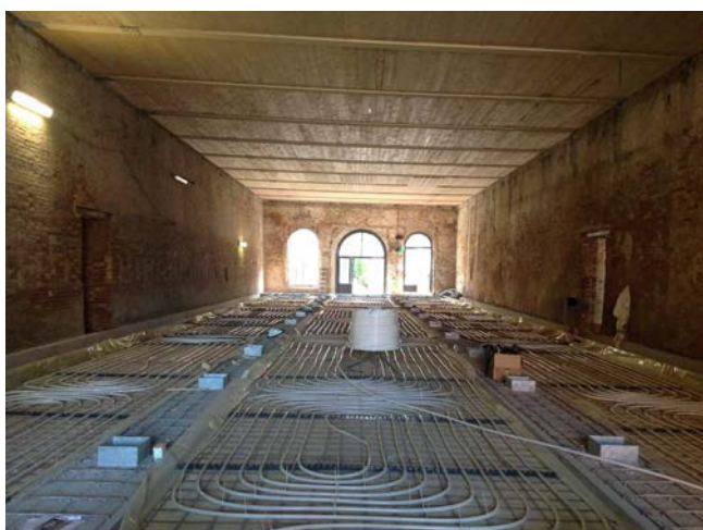
SALA D'ARMI BIENNALE DI VENEZIA impianto di riscaldamento del tipo radiante a pavimento e condizionamento di un edificio ad uso terziario.