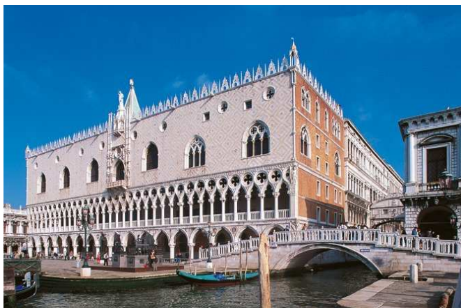
PALAZZO DUCALE (VENEZIA) Lavori di adeguamento impiantistica elettrica ed antincendio. Adeguamento VV.FF.