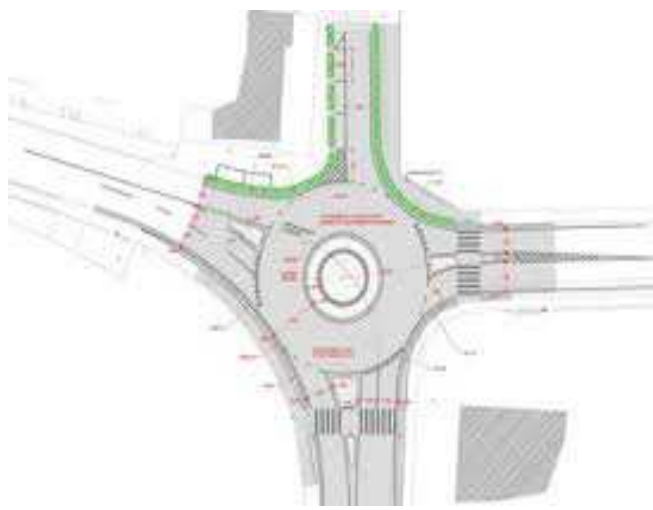
Realizzazione parcheggio Capolinea tramvia (area Marghera Village), lavori di manutenzione alla viabilità carrabile nei punti di crisi di Pellestrina, P.le Roma, Tronchetto.